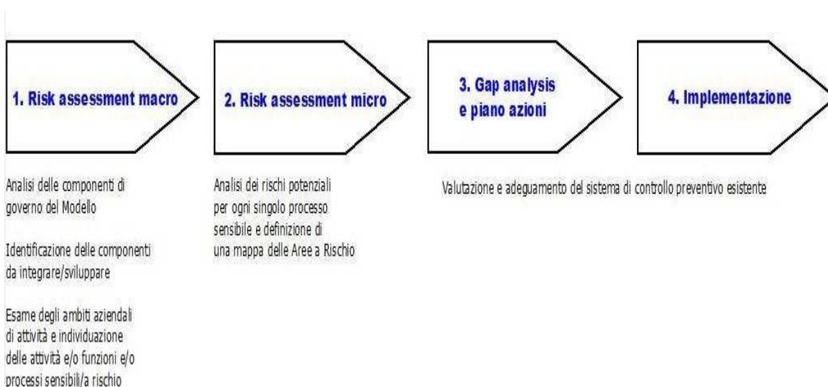
Fig. 2 Progetto 231 di PLT energia.

In particolare, la realizzazione del Modello di PLT energia si è articolata nelle seguenti fasi: