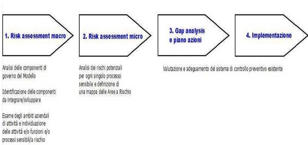
Fig. 2 Progetto 231 di PLT energia.

In particolare, la realizzazione del Modello di PLT energia si è articolata nelle seguenti fasi: